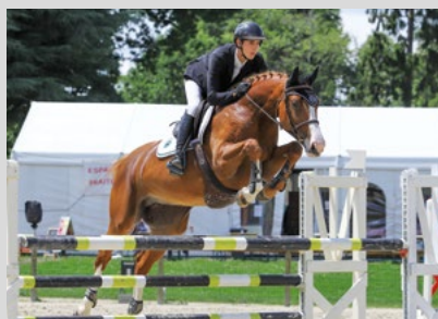
FALLING IN LOVE DK (mère par Arko III), né chez R. DICK (14)